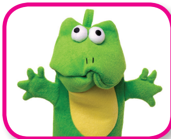
Juegos y canciones De 24 a 36 meses