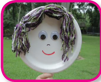
Títtere de plato de papel De 18 a 24 meses