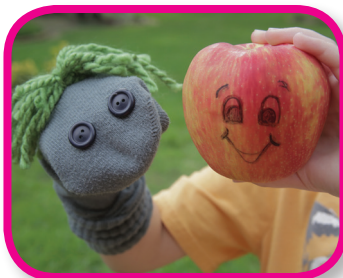
Willy the Worm 24-36 months