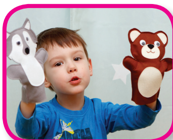
Plática de títeres De 30 a 36 meses